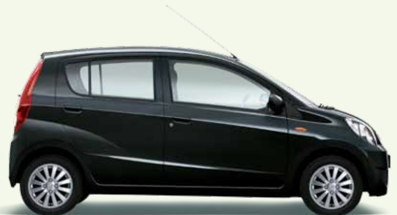
Schwarz Perleffekt (X07)