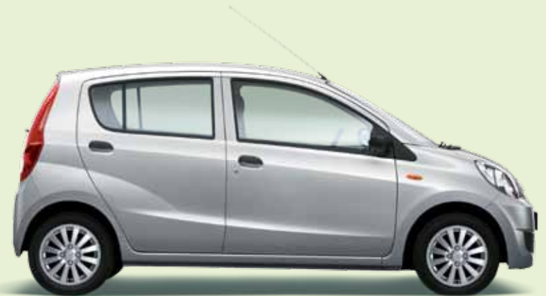
Arktissilber Perleffekt (S28)

» Egal, ob mit Perleffektlackierung* in Arktissilber und Schwarz oder in den Standardlackierungen Weiß und Rot – mit unseren attraktiven Farben sind Ihnen überall anerkennende Blicke und ein bewunderndes „Wow!“ sicher. Wählen Sie einfach Ihre Lieblingsfarbe für Ihren Cuore und machen Sie es sich bequem. Und seien Sie nicht irritiert, wenn Sie statt „Wow!“ auch mal ein „Guck mal da!“ oder „Will ich auch!“ hören.